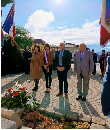
Hommage du 8 mai en présence du CMJ, des élus du territoire, des sapeurs-pompiers, des portedrapeaux et de nos musiciens.