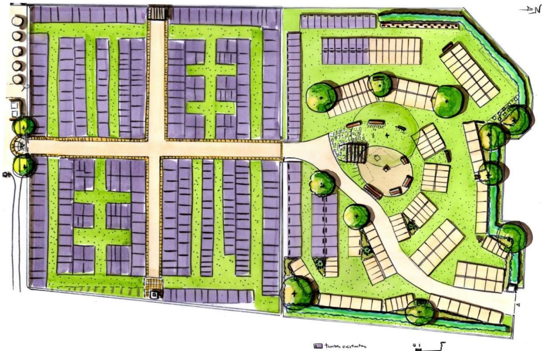
Aménagement paysager du cimetière de la BIOLLE

Le projet d’extension du nouveau cimetière, avec notamment la nécessité d’installer des colombariums supplémentaires, a amené à travailler un plan global pour repenser le cimetière et son environnement. Aussi, il est proposé dans un premier temps de désimperméabiliser les allées secondaires et de planter les futurs arbres d’ombrage dans le nouveau cimetière. Le coût des travaux est estimé à 21 000 € HT. Une subvention est demandée à l’Etat au titre de ce projet s’inscrivant dans une démarche de transition écologique.